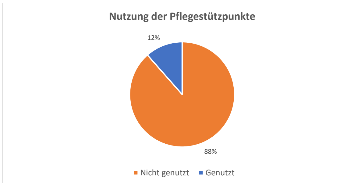
Abbildung 1: Nutzung der Pflegestützpunkte

Lediglich 12% der Befragten nutzen das Beratungsangebot der Pflegestützpunkte